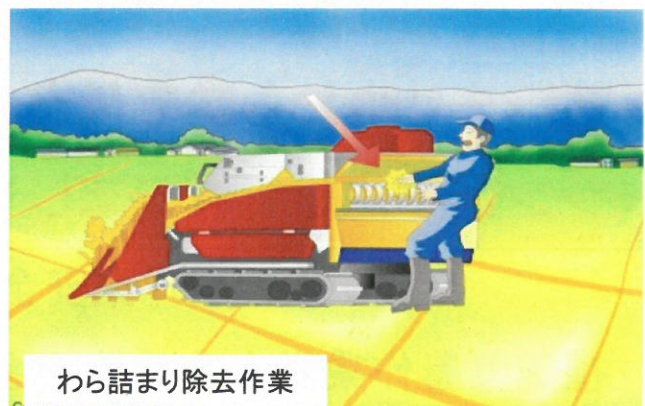
わら詰まり除去作業