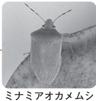
ミナミアオカメムシ

出穂10日前までに、カメムシ類の居場所となる畦畔・草ムラの除草を徹底して、圃場への侵入をふせぎましょう。