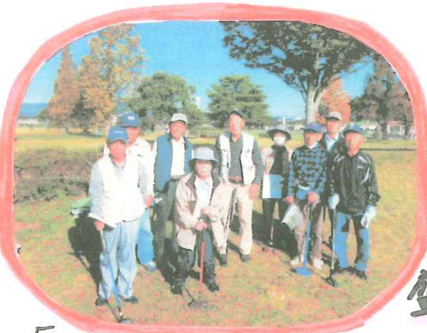
「嘉穂地区出場メンバー」

令和4年10月12日(水)桂川町グラウンド ゴルフ場にて第15回ふくおか嘉穂年金 友の会グラウンドゴルフ大会が開催されました! 3年ぶりの大会とあっておなさん大いに 盛り上がりすばらしい大会となりました!!