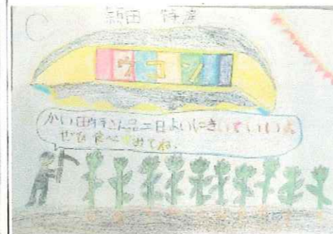
《子供たちが考えてくれたラベルデザイン》